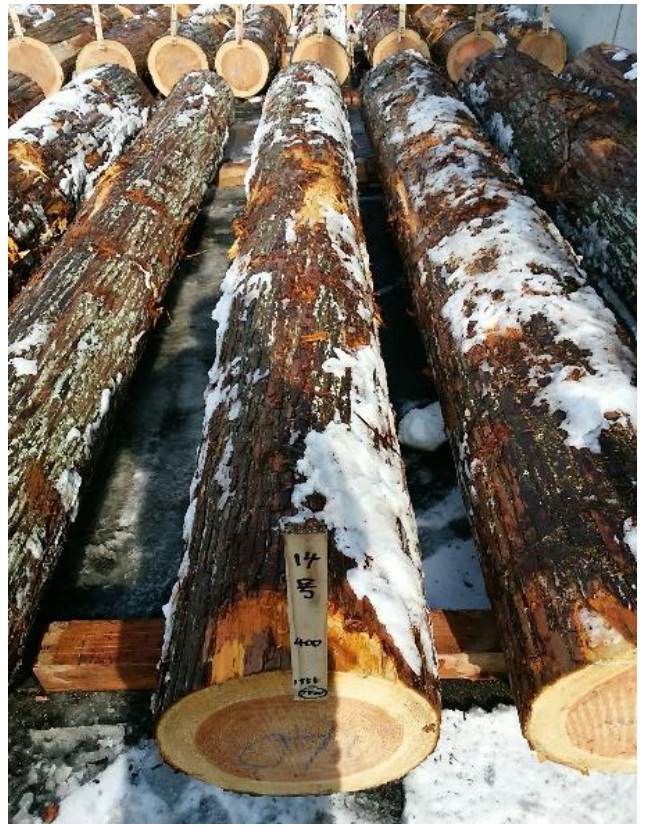
樹種: スギ 材長: 4.00 m 管理No. 14 径級: 40 cm 本数: 1 材積: 0.640 m 3