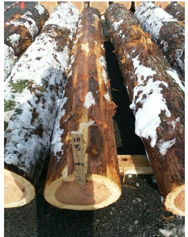
樹種: スギ 材長: 4.00 m 管理No. 18 径級: 38 cm 本数: 1 材積: 0.578 m 3