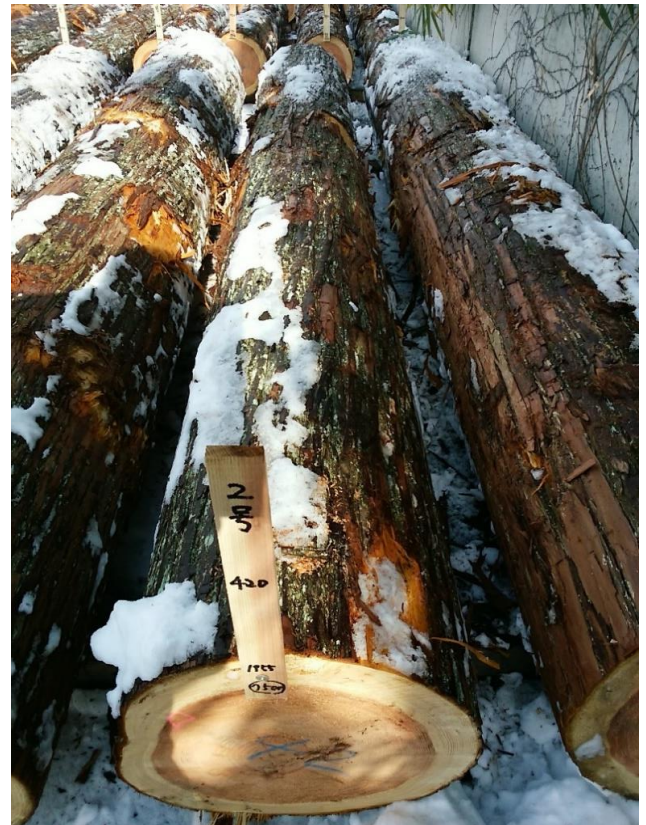
樹種: スギ 材長: 4.00 m 管理No. 2 径級: 42 cm 本数: 1 材積: 0.706 m 3