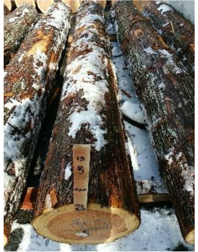
樹種: スギ 材長: 4.00 m 管理No. 13 径級: 42 cm 本数: 1 材積: 0.706 m 3