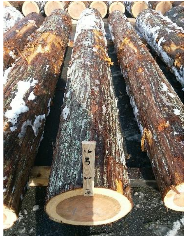
樹種: スギ 材長: 4.00 m 管理No. 16 径級: 42 cm 本数: 1 材積: 0.706 m 3