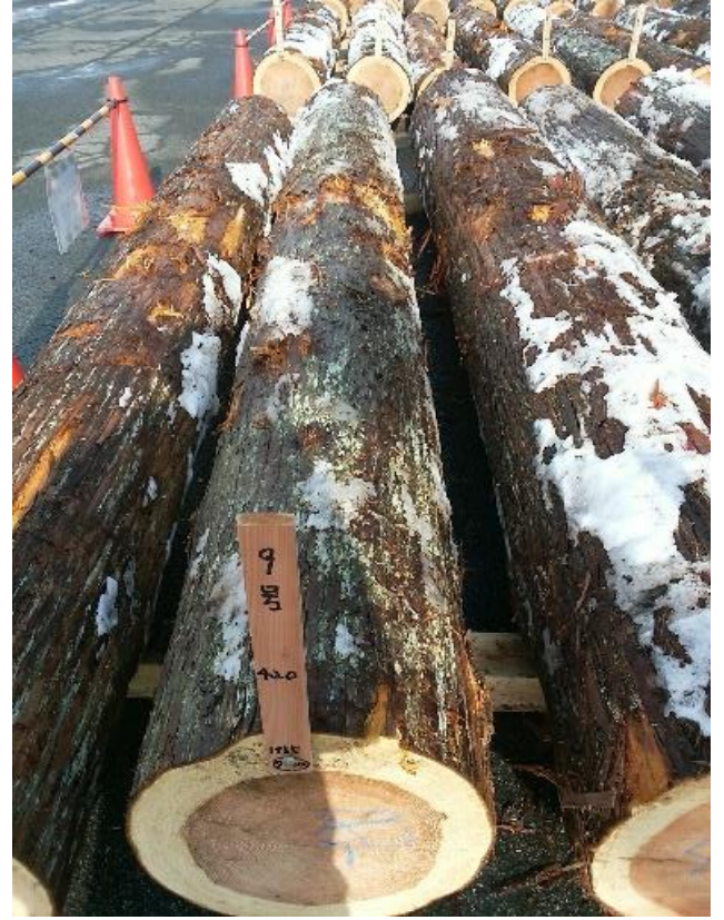
樹種: スギ 材長: 4.00 m 管理No. 9 径級: 42 cm 本数: 1 材積: 0.706 m 3