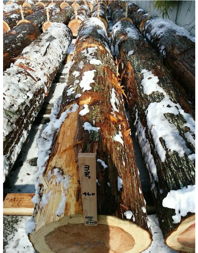
樹種: スギ 材長: 4.00 m 管理No. 3 径級: 46 cm 本数: 1 材積: 0.846 m 3