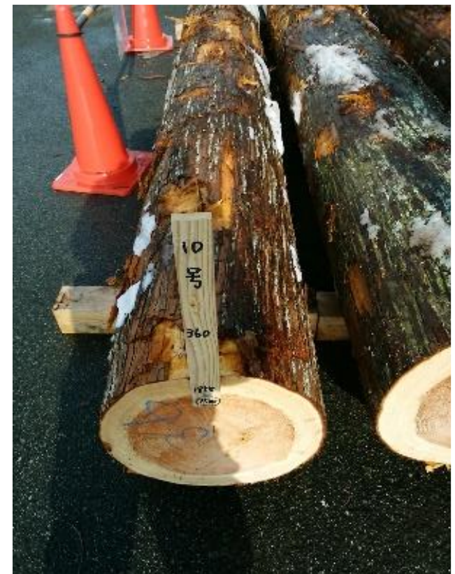
樹種: スギ 材長: 4.00 m 管理No. 10 径級: 36 cm 本数: 1 材積: 0.518 m 3