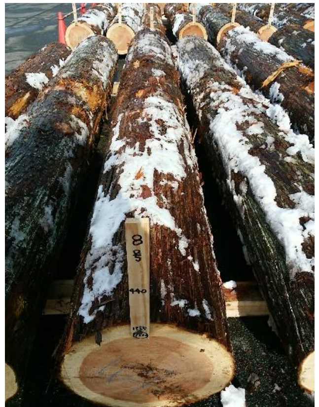
樹種: スギ 材長: 4.00 m 管理No. 8 径級: 44 cm 本数: 1 材積: 0.774 m 3