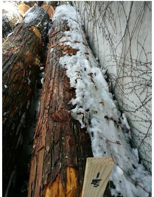
樹種: スギ 材長: 4.00 m 管理No. 1 径級: 44 cm 本数: 1 材積: 0.774 m 3