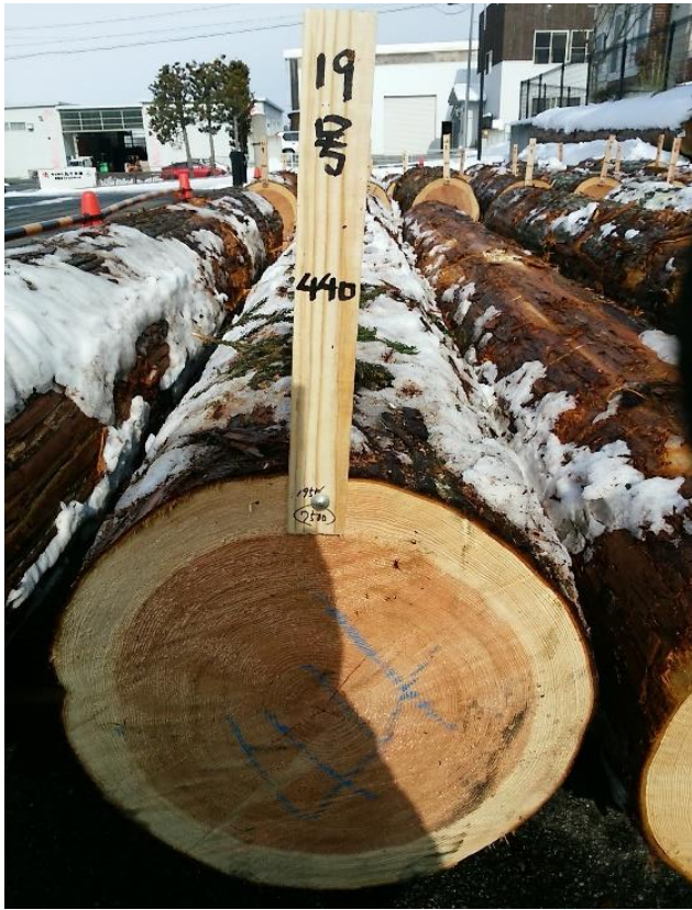
樹種: スギ 材長: 4.00 m 管理No. 19 径級: 44 cm 本数: 1 材積: 0.774 m 3