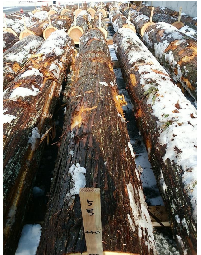
樹種: スギ 材長: 4.00 m 管理No. 5 径級: 44 cm 本数: 1 材積: 0.774 m 3