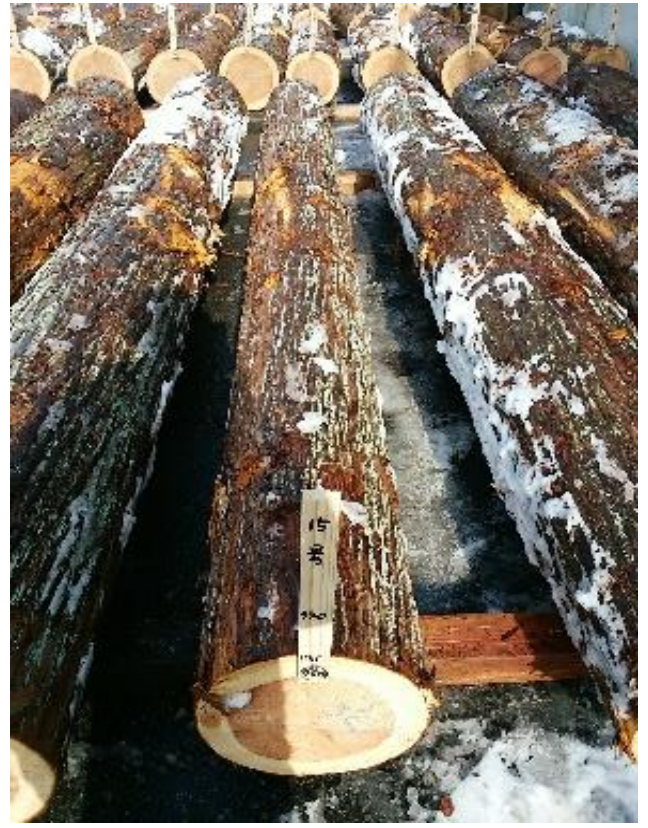
樹種: スギ 材長: 4.00 m 管理No. 15 径級: 34 cm 本数: 1 材積: 0.462 m 3