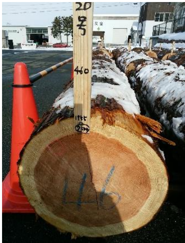
樹種: スギ 材長: 4.00 m 管理No. 20 径級: 46 cm 本数: 1 材積: 0.846 m 3