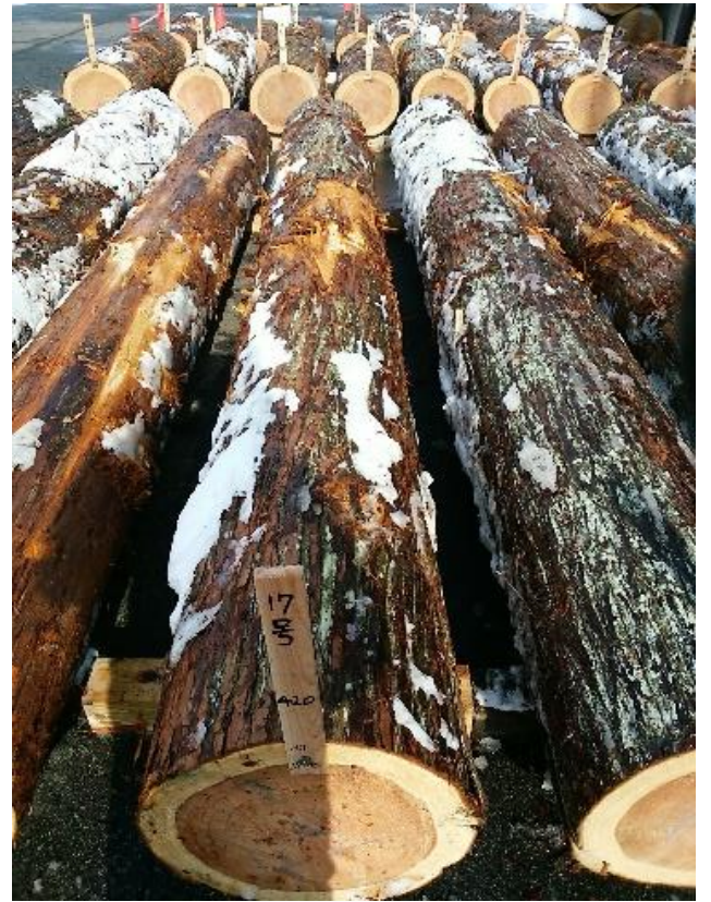
樹種: スギ 材長: 4.00 m 管理No. 17 径級: 42 cm 本数: 1 材積: 0.706 m 3