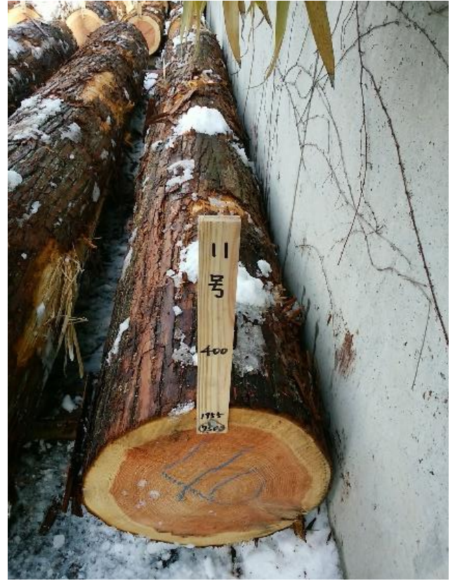
樹種： スギ 材長： 4.00 m 管理No. 11 径級： 40 cm 本数： 1 材積： 0.640 m 3