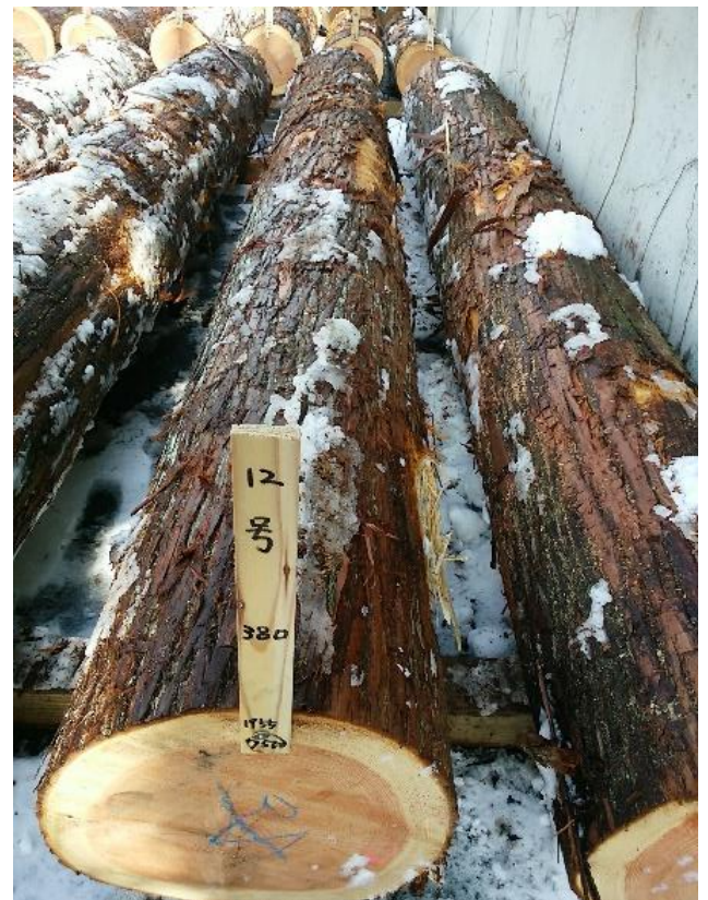
樹種： スギ 材長： 4.00 m 管理No. 12 径級： 38 cm 本数： 1 材積： 0.578 m 3