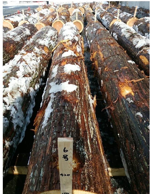
樹種: スギ 材長: 4.00 m 管理No. 6 径級: 42 cm 本数: 1 材積: 0.706 m 3