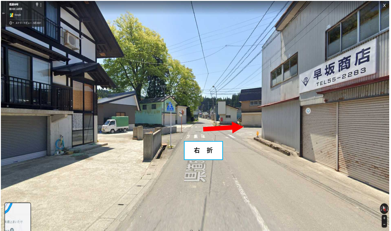
写真④斜め右に進む。450m先羽根沢林道土場。