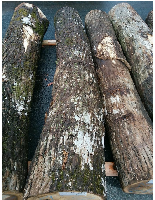
樹種: オニグルミ 材長: 2.00 m 管理No. 55 径級: 32 cm 本数: 1 材積: 0.205 m 3