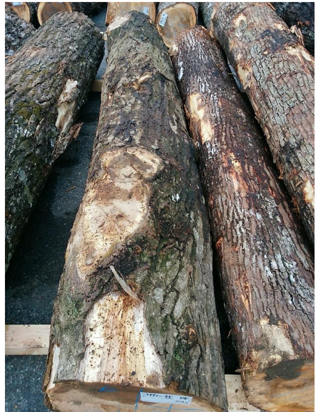
樹種: オニグルミ 材長: 2.40 m 管理No. 35 径級: 32 cm 本数: 1 材積: 0.246 m 3