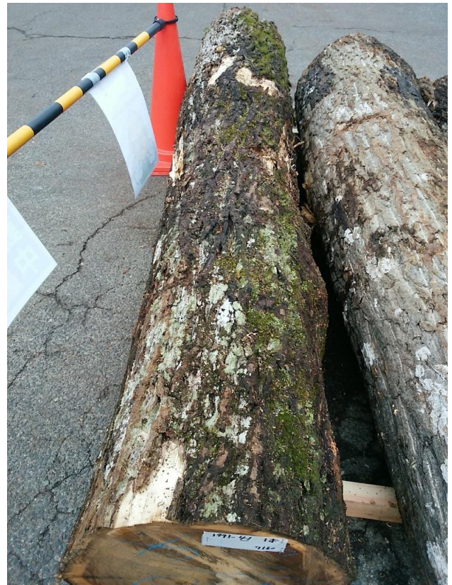
樹種： オニグルミ 材長： 2.40 m 管理No. 41 径級： 40 cm 本数： 1 材積： 0.384 m 3