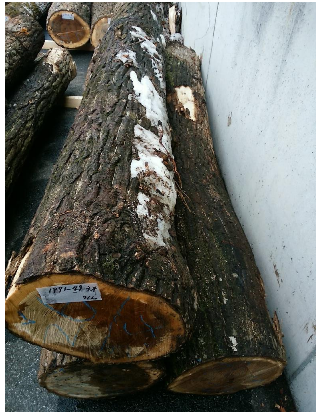
樹種: オニグルミ 材長: 2.40 m 管理No. 49 径級: 26-28 cm 本数: 3 材積: 0.538 m 3