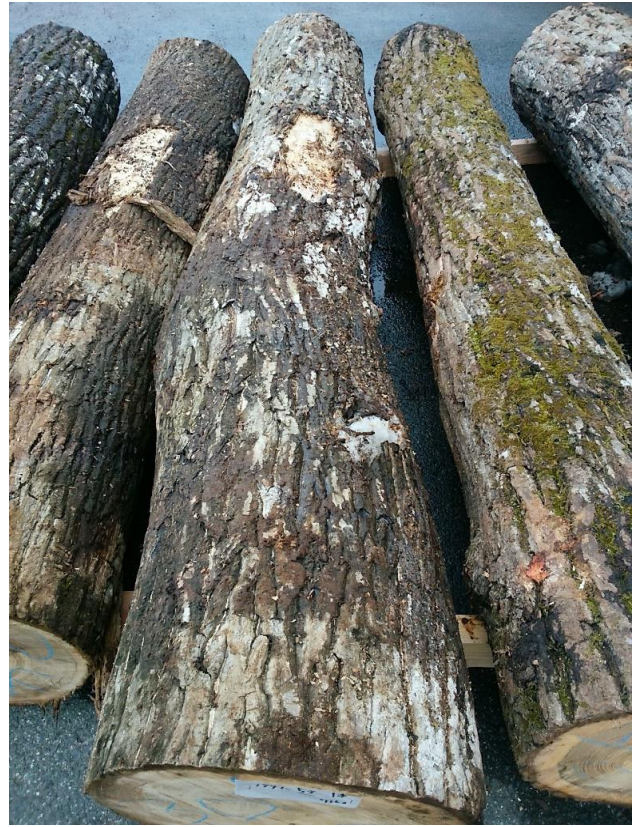
樹種: オニグルミ 材長: 2.40 m 管理No. 53 径級: 30 cm 本数: 1 材積: 0.216 m 3