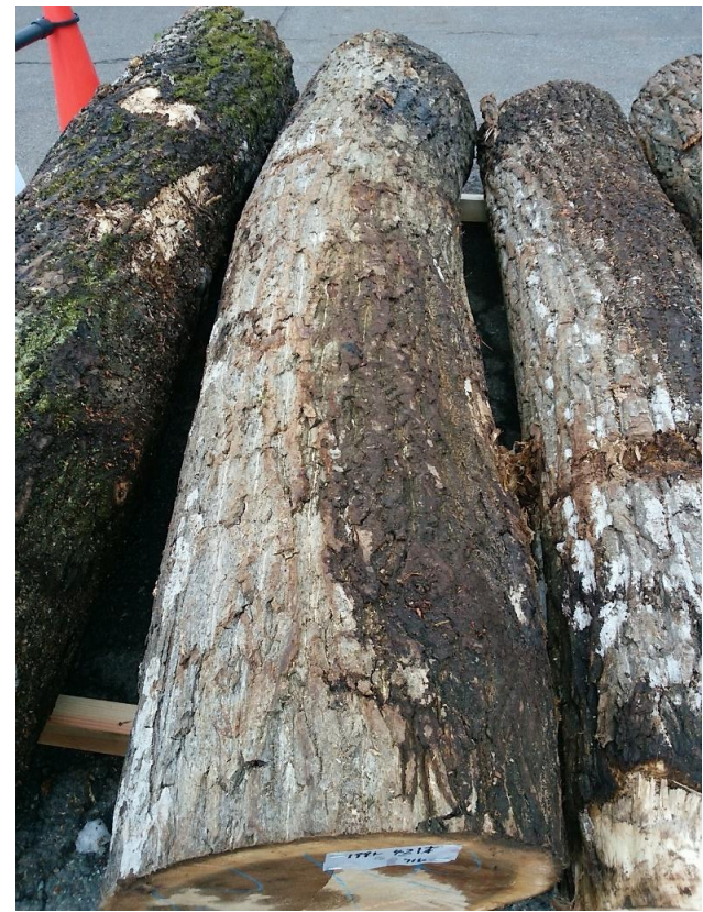
樹種： オニグルミ 材長： 2.10 m 管理No. 42 径級： 36 cm 本数： 1 材積： 0.272 m 3