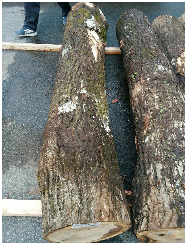
樹種: オニグルミ 材長: 2.10 m 管理No. 56 径級: 32 cm 本数: 1 材積: 0.215 m 3