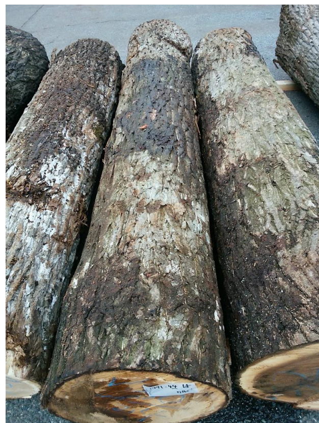
樹種： オニグルミ 材長： 2.40 m 管理No. 44 径級： 30 cm 本数： 1 材積： 0.216 m 3