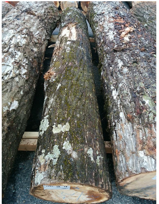
樹種: オニグルミ 材長: 2.40 m 管理No. 38 径級: 30 cm 本数: 1 材積: 0.216 m 3