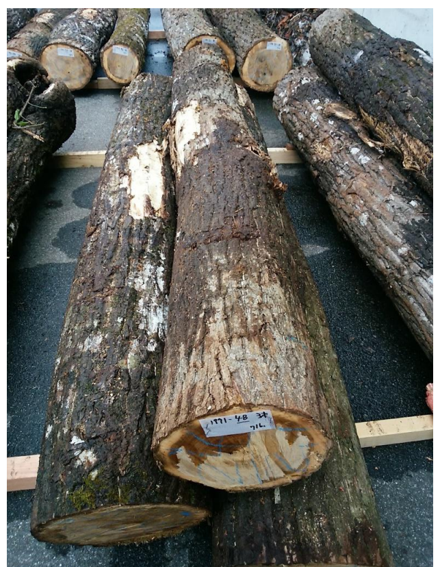
樹種： オニグルミ 材長： 2.10-2.20 m 管理No. 48 径級： 20-32 cm 本数： 3 材積： 0.434 m 3