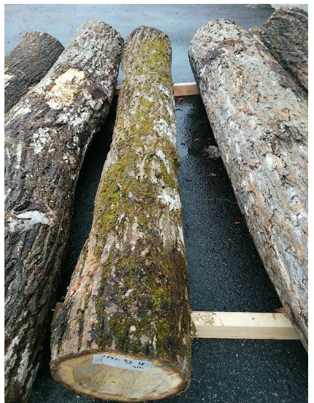
樹種: オニグルミ 材長: 2.10 m 管理No. 52 径級: 26 cm 本数: 1 材積: 0.142 m 3