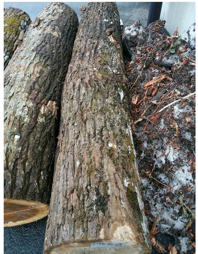
樹種: オニグルミ 材長: 2.40 m 管理No. 50 径級: 32 cm 本数: 1 材積: 0.246 m 3