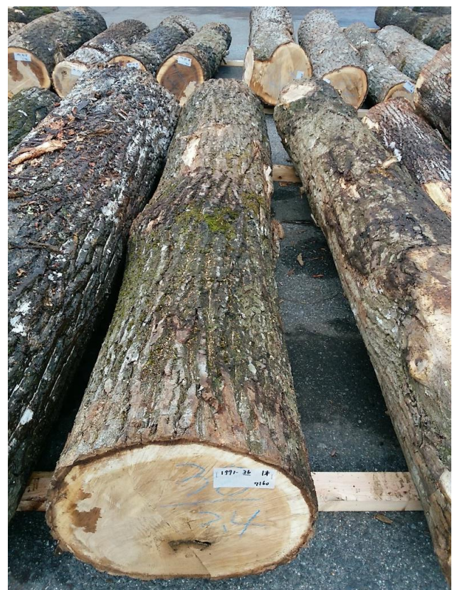
樹種: オニグルミ 材長: 2.40 m 管理No. 36 径級: 38 cm 本数: 1 材積: 0.347 m 3