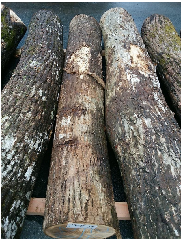
樹種: オニグルミ 材長: 2.40 m 管理No. 54 径級: 24 cm 本数: 1 材積: 0.138 m 3