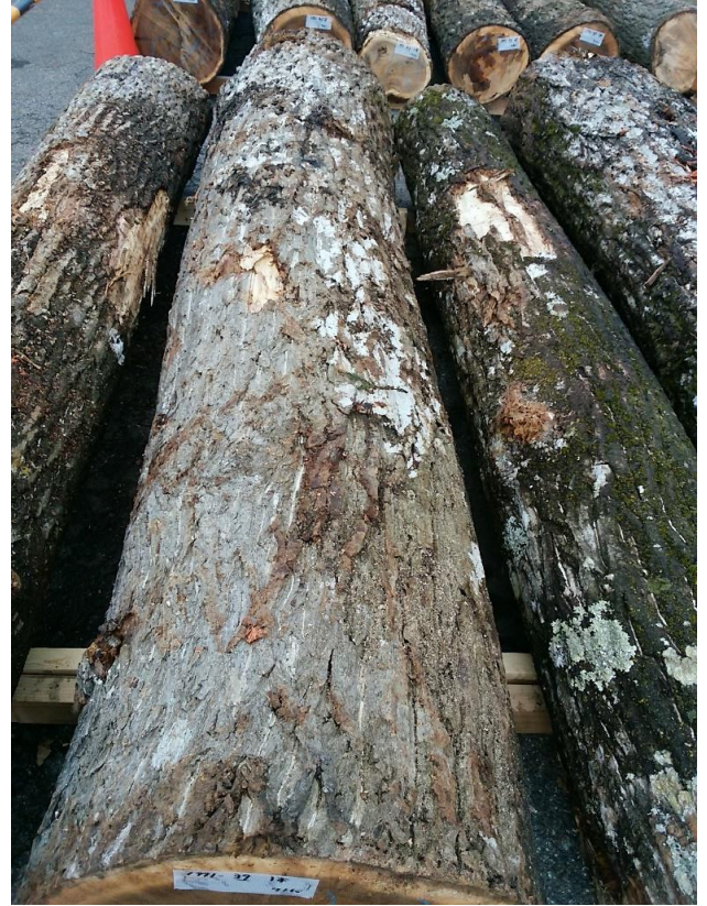
樹種: オニグルミ 材長: 2.40 m 管理No. 39 径級: 44 cm 本数: 1 材積: 0.465 m 3