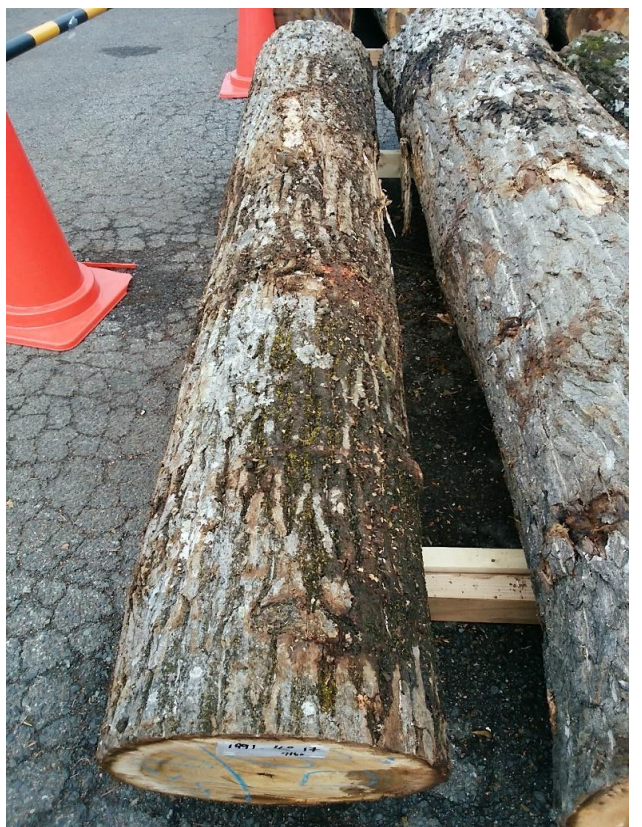
樹種: オニグルミ 材長: 2.40 m 管理No. 40 径級: 30 cm 本数: 1 材積: 0.216 m 3