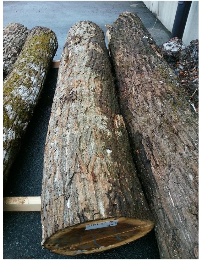
樹種: オニグルミ 材長: 2.40 m 管理No. 51 径級: 32 cm 本数: 1 材積: 0.246 m 3