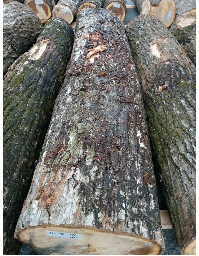
樹種: オニグルミ 材長: 2.40 m 管理No. 37 径級: 38 cm 本数: 1 材積: 0.347 m 3