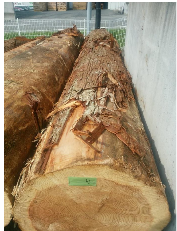
樹種: スギ 材長: 4.00 m 管理No. 61 径級: 66 cm 本数: 1 材積: 1.742 m 3