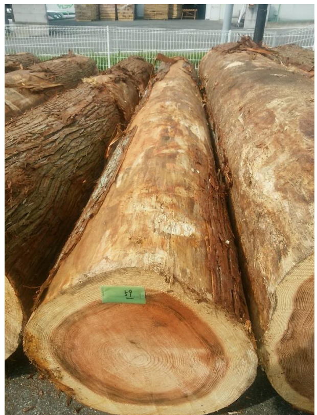
樹種: スギ 材長: 4.00 m 管理No. 59 径級: 50 cm 本数: 1 材積: 1.000 m 3