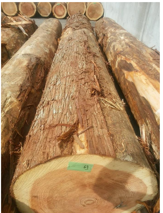
樹種: スギ 材長: 4.00 m 管理No. 63 径級: 56 cm 本数: 1 材積: 1.254 m 3