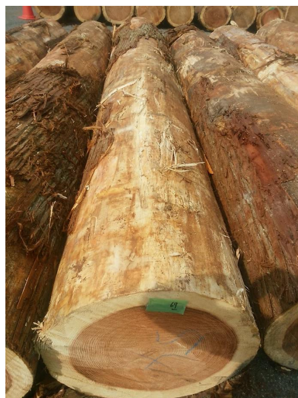
樹種: スギ 材長: 4.00 m 管理No. 69 径級: 54 cm 本数: 1 材積: 1.166 m 3