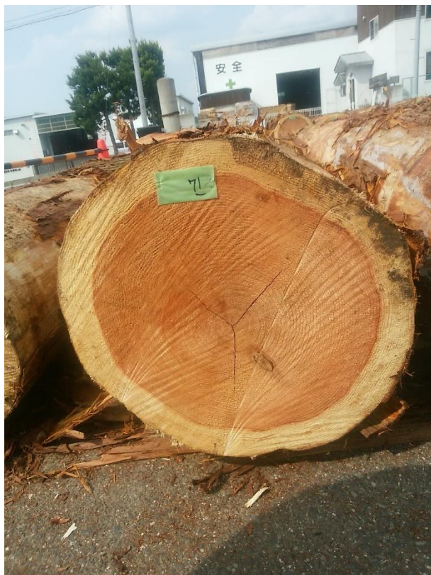
樹種: スギ 材長: 4.00 m 管理No. 71 径級: 48 cm 本数: 1 材積: 0.922 m 3