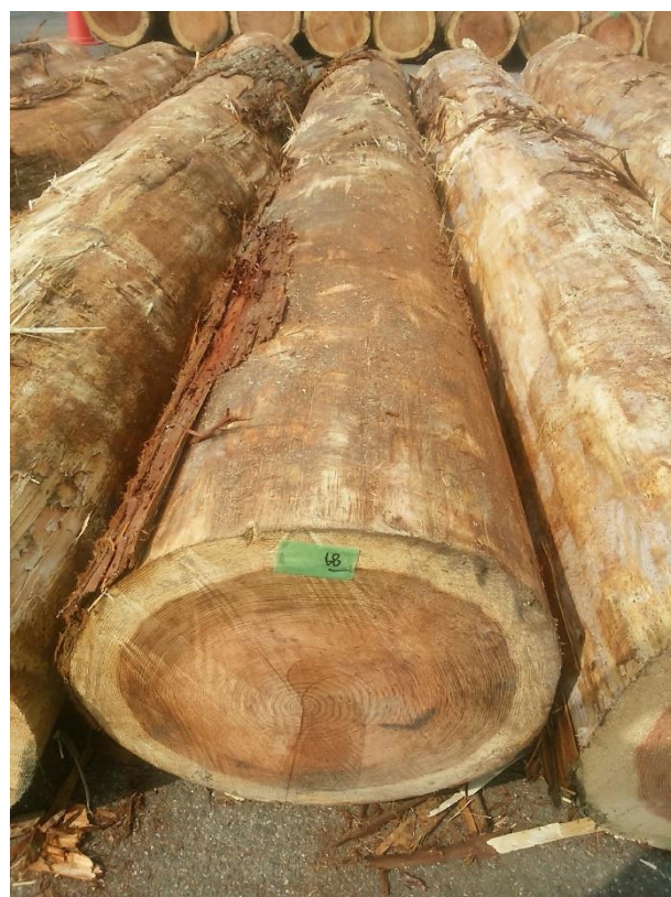
樹種: スギ 材長: 4.00 m 管理No. 68 径級: 50 cm 本数: 1 材積: 1.000 m 3