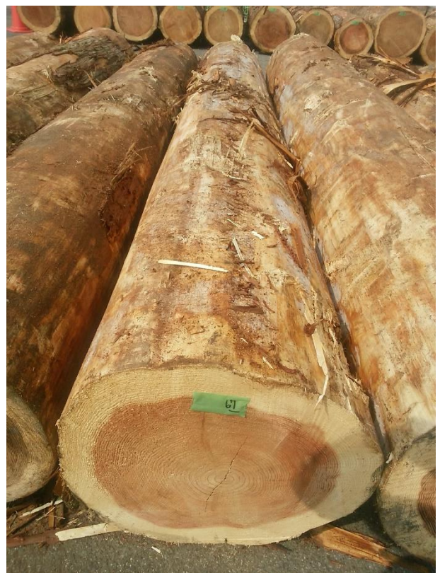
樹種: スギ 材長: 4.00 m 管理No. 67 径級: 54 cm 本数: 1 材積: 1.166 m 3