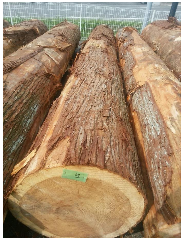
樹種: スギ 材長: 4.00 m 管理No. 58 径級: 50 cm 本数: 1 材積: 1.000 m 3