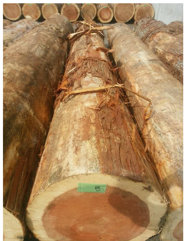
樹種: スギ 材長: 4.00 m 管理No. 65 径級: 50 cm 本数: 1 材積: 1.000 m 3