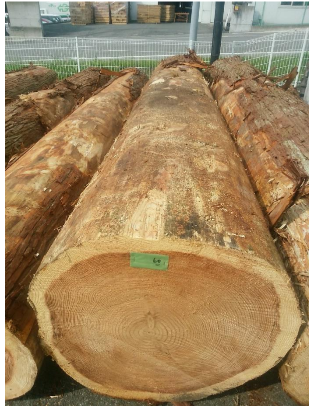
樹種: スギ 材長: 4.00 m 管理No. 60 径級: 66 cm 本数: 1 材積: 1.742 m 3