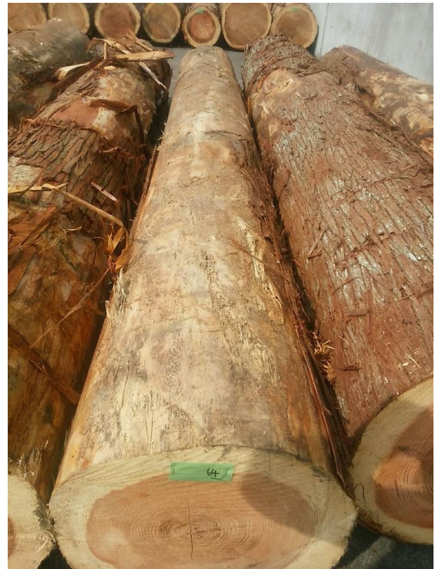
樹種: スギ 材長: 4.00 m 管理No. 64 径級: 46 cm 本数: 1 材積: 0.846 m 3