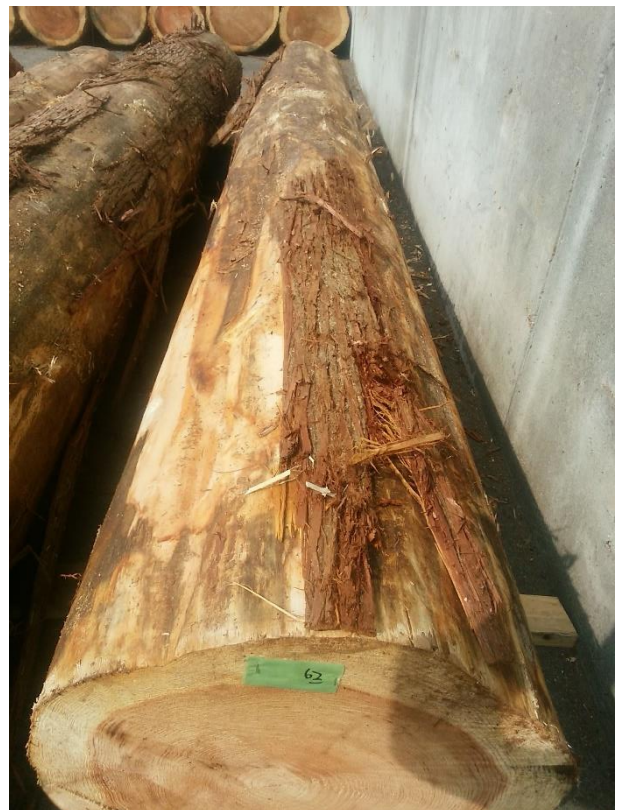
樹種: スギ 材長: 4.00 m 管理No. 62 径級: 50 cm 本数: 1 材積: 1.000 m 3