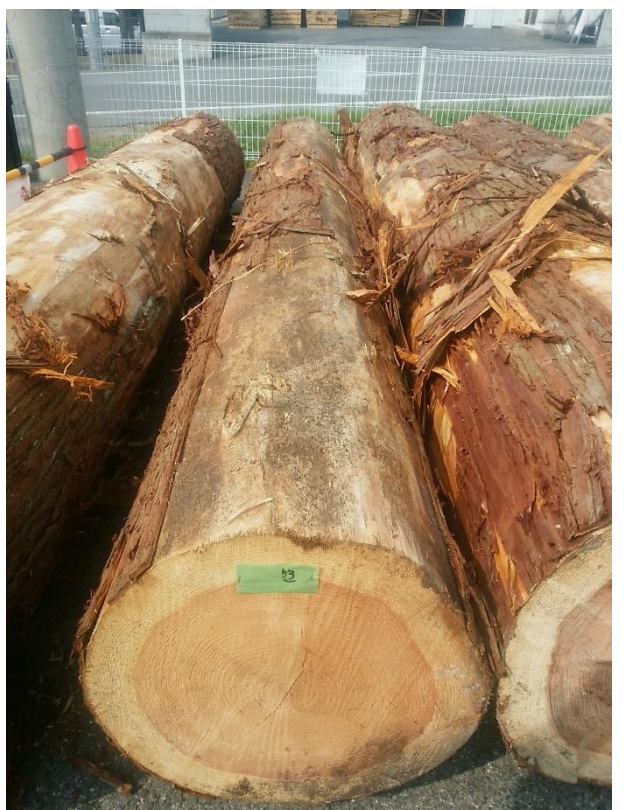
樹種: スギ 材長: 4.00 m 管理No. 53 径級: 50 cm 本数: 1 材積: 1.000 m 3