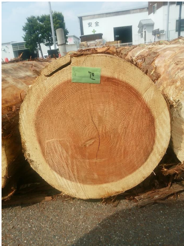
樹種: スギ 材長: 4.00 m 管理No. 70 径級: 48 cm 本数: 1 材積: 0.922 m 3