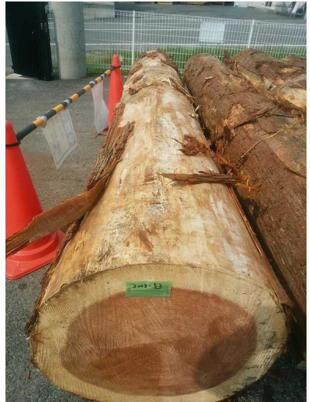
樹種: スギ 材長: 4.00 m 管理No. 52 径級: 56 cm 本数: 1 材積: 1.254 m 3