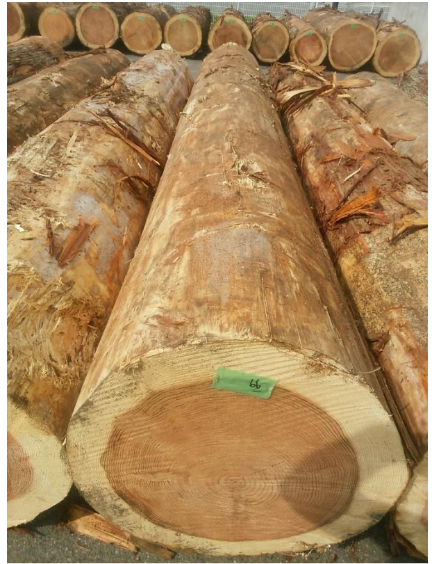
樹種: スギ 材長: 4.00 m 管理No. 66 径級: 58 cm 本数: 1 材積: 1.346 m 3