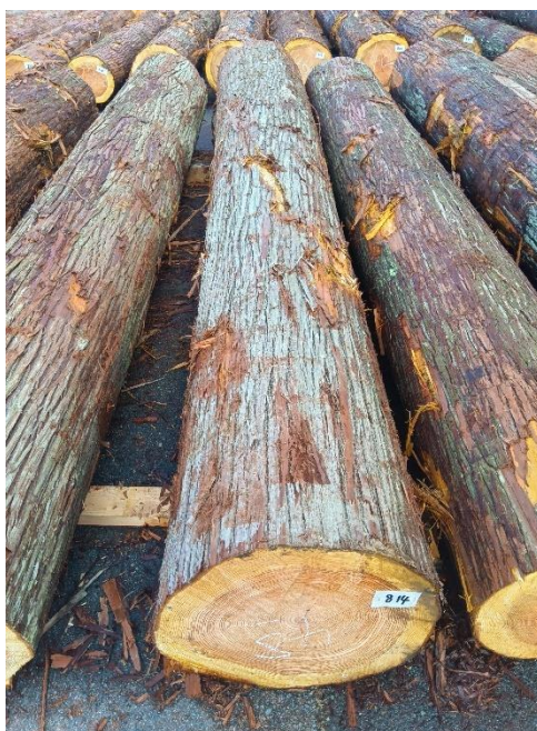
管理 NO.814 材長:4m 径級:48cm 材積:0.922 m 3