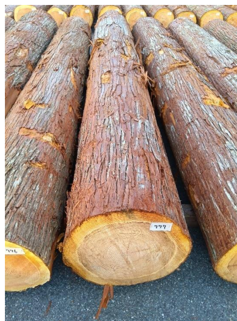
管理 NO.777 材長:4m 径級:50cm 材積:1.000 m 3