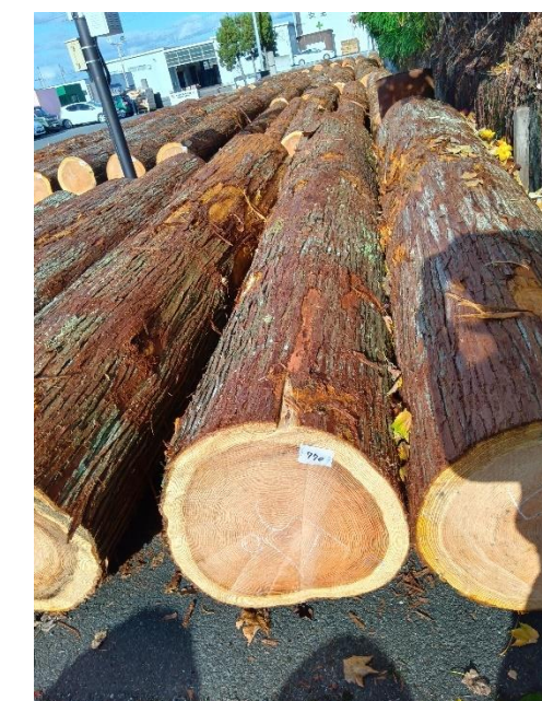
管理 NO.770 材長:4m 径級:56cm 材積:1.254 m 3