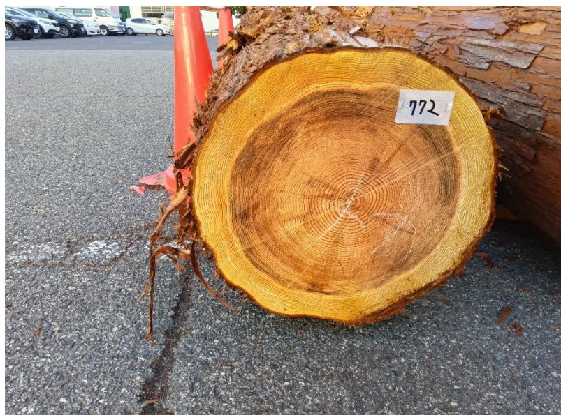
管理 NO.772 材長:4m 径級:44cm 材積:0.774 m 3