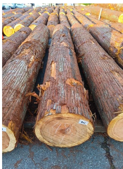
管理 NO.802 材長:4m 径級:48cm 材積:0.922 m 3