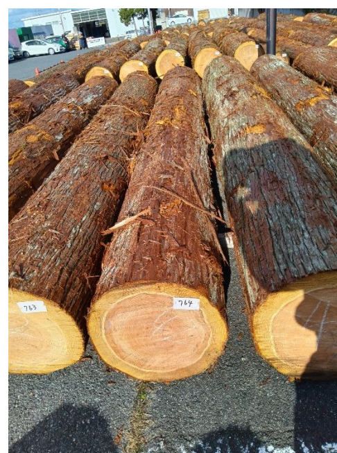
管理 NO.764 材長:4m 径級:42cm 材積:0.706 m 3