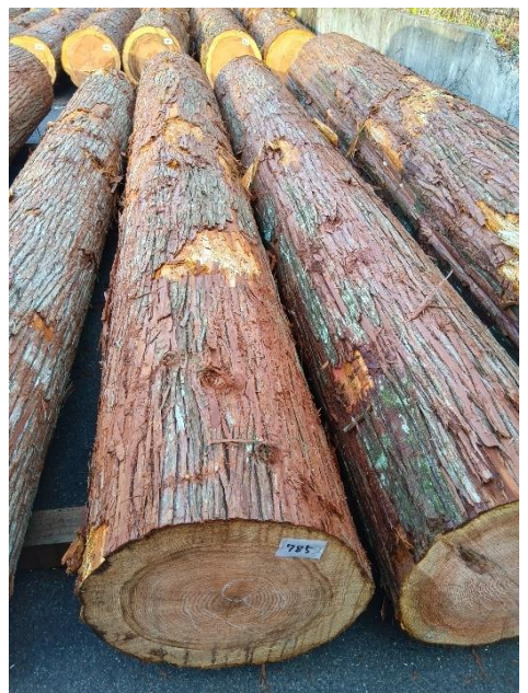
管理 NO.785 材長:4m 径級:48cm 材積:0.922 m 3