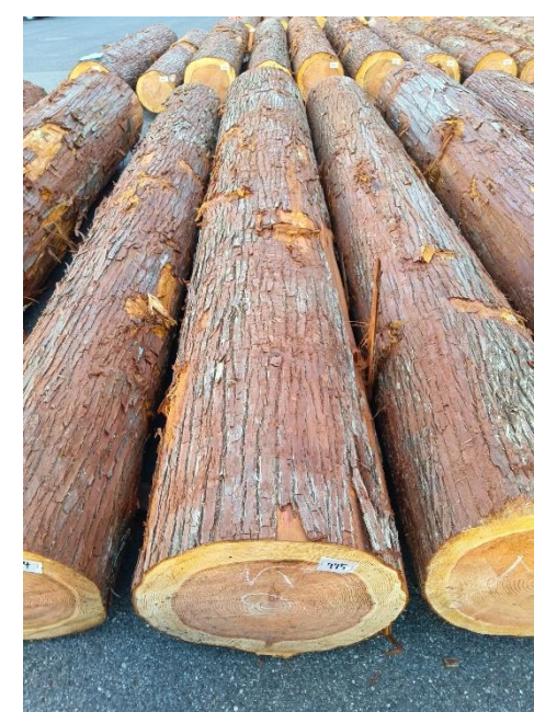
管理 NO.775 材長:4m 径級:50cm 材積:1.000 m 3