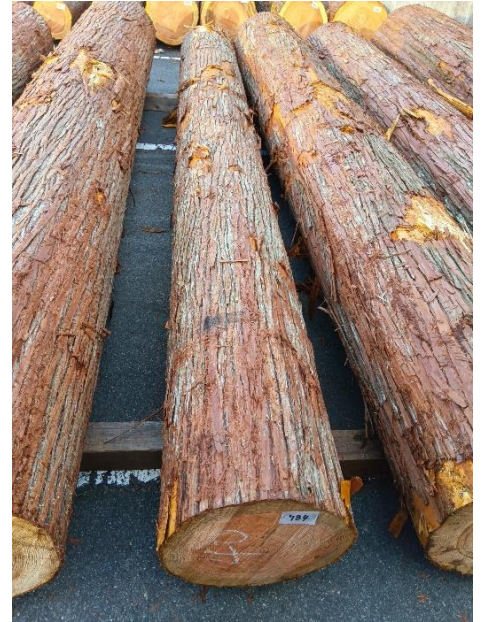
管理 NO.784 材長:4m 径級:40cm 材積:0.640 m 3