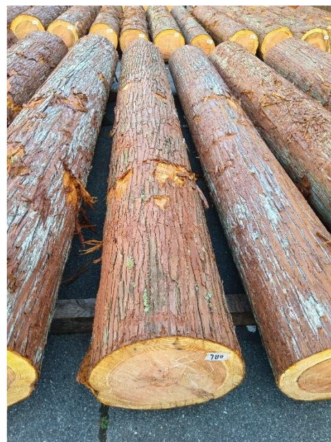
管理 NO.780 材長:4m 径級:42cm 材積:0.706 m 3