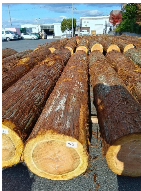
管理 NO.762 材長:4m 径級:46cm 材積:0.846 m 3