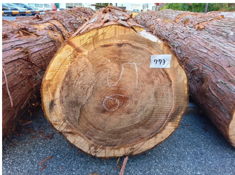
管理 NO.773 材長:4m 径級:56cm 材積:1.254 m 3