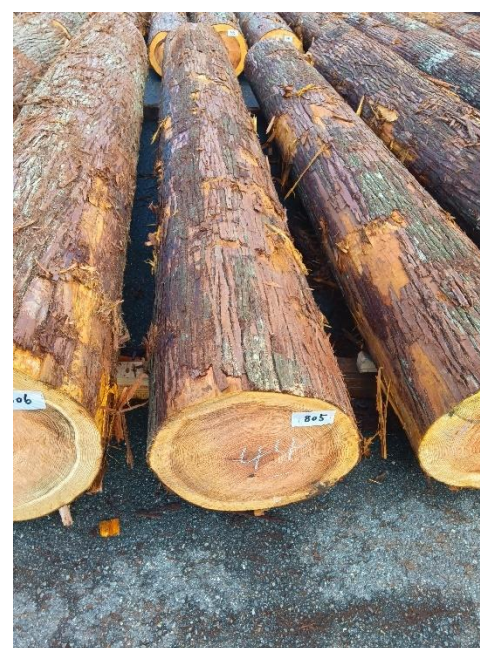
管理 NO.805 材長:4m 径級:44cm 材積:0.774 m 3