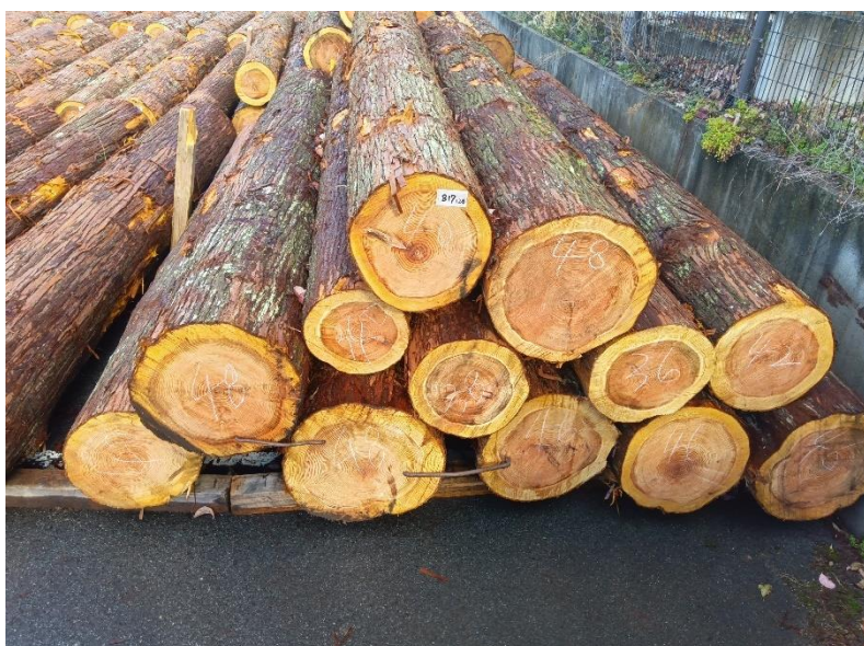
管理 NO.817 材長:4m 径級:34~48cm 12本 材積:8.848 m 3