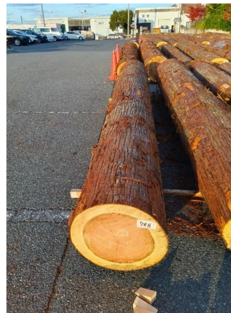
管理 NO.788 材長:4m 径級:46cm 材積:0.846 m 3