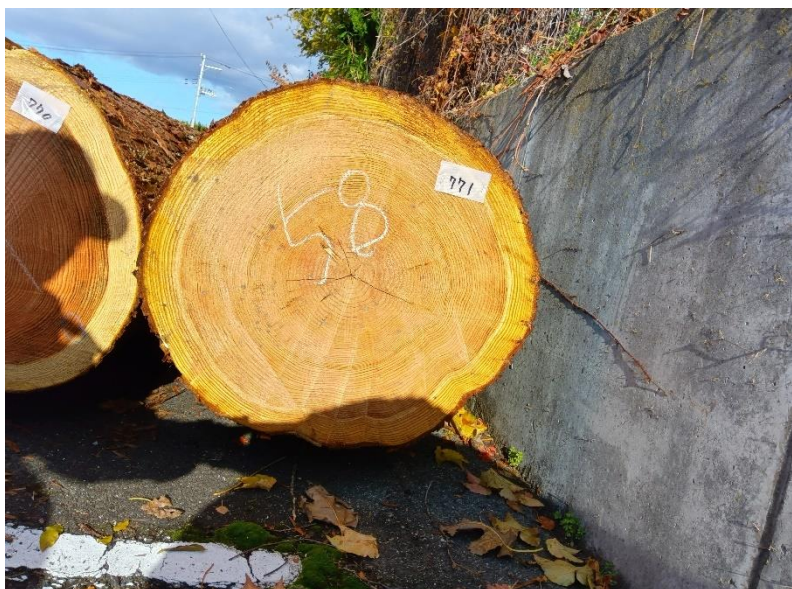
管理 NO.771 材長:4m 径級:58cm 材積:1.346 m 3