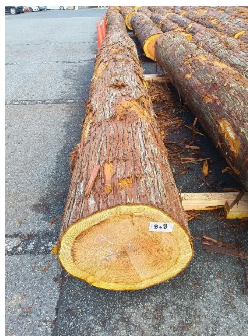
管理 NO.808 材長:4m 径級:48cm 材積:0.922 m 3