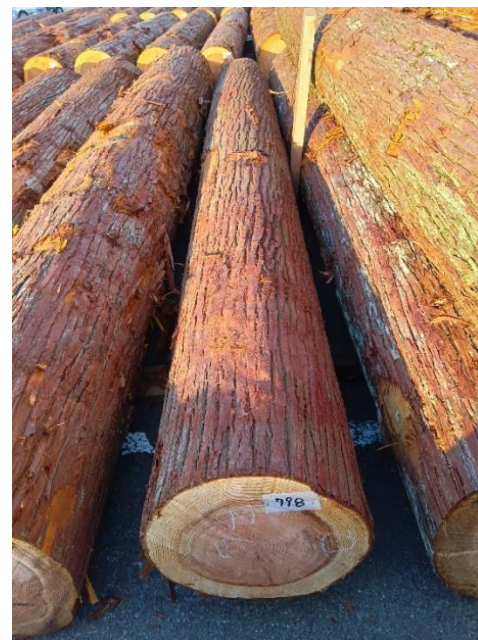
管理 NO.798 材長:4m 径級:36cm 材積:0.518 m 3