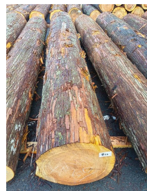
管理 NO.812 材長:4m 径級:50cm 材積:1.000 m 3