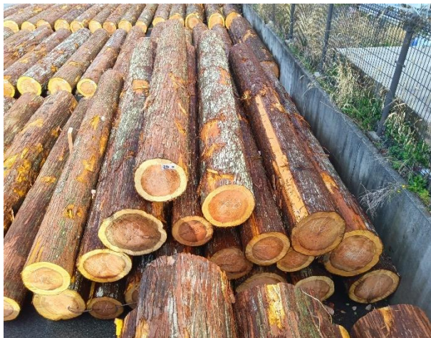
管理 NO.816 材長:4m 径級:30~50cm 19本 材積:12.456 m 3