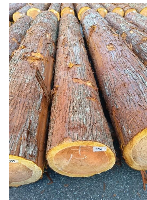
管理 NO.776 材長:4m 径級:42cm 材積:0.706 m 3