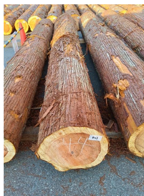
管理 NO.803 材長:4m 径級:44cm 材積:0.774 m 3