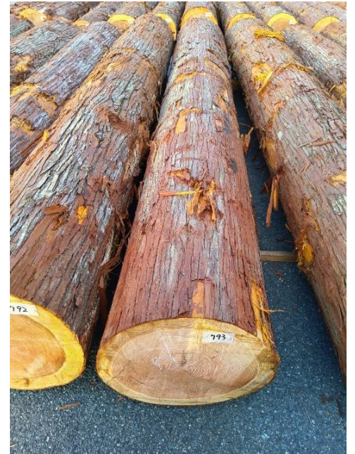
管理 NO.793 材長:4m 径級:48cm 材積:0.992 m 3