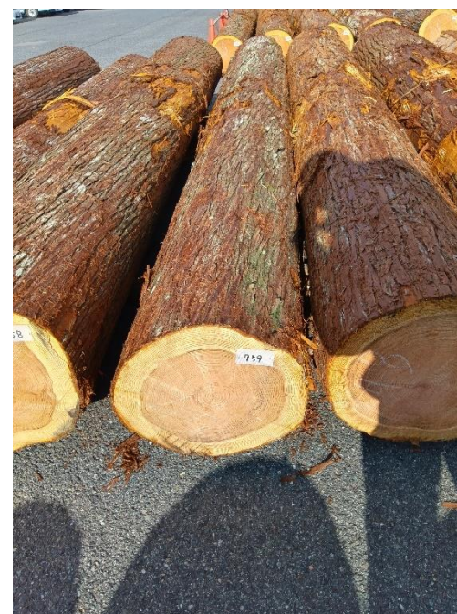
管理 NO.759 材長:4m 径級:44cm 材積:0.774 m 3