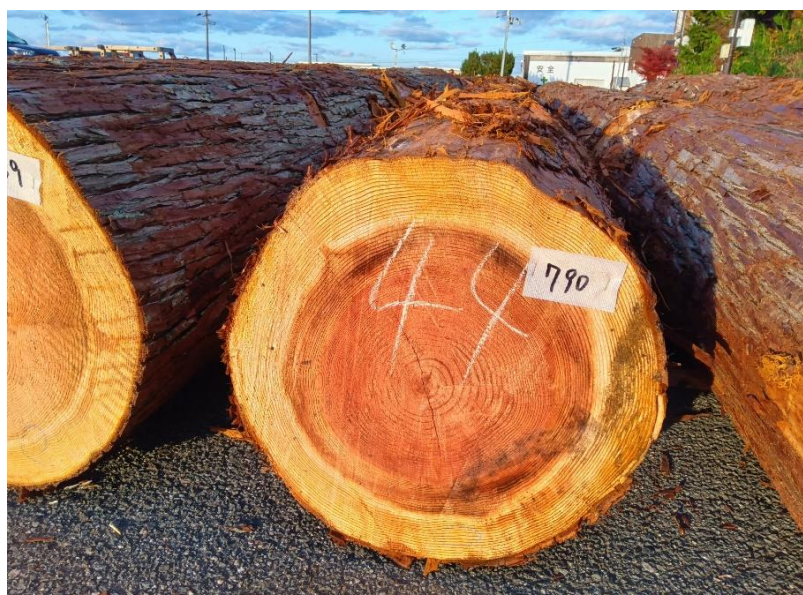
管理 NO.790 材長:4m 径級:44cm 材積:0.774 m 3