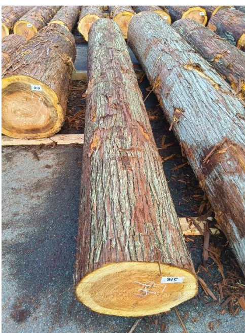
管理 NO.815 材長:4m 径級:46cm 材積:0.846 m 3