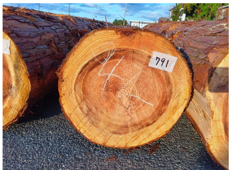
管理 NO.791 材長:4m 径級:42cm 材積:0.706 m 3