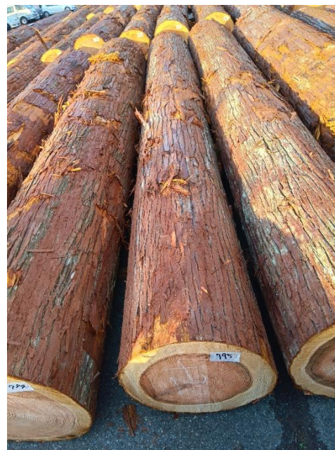
管理 NO.795 材長:4m 径級:42cm 材積:0.706 m 3