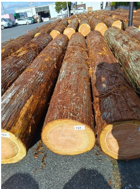
管理 NO.763 材長:4m 径級:42cm 材積:0.706 m 3