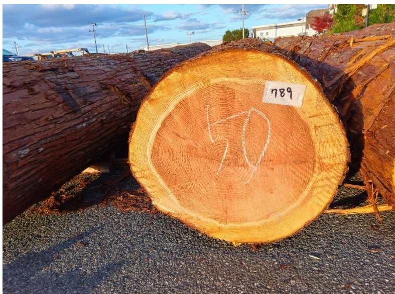
管理 NO.789 材長:4m 径級:50cm 材積:1.000 m 3