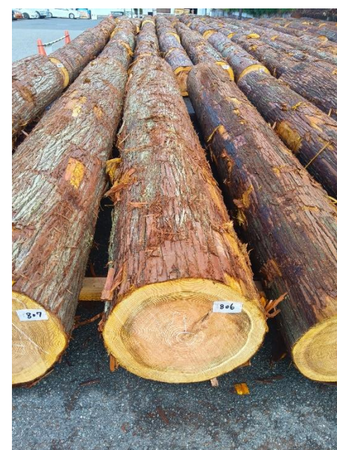
管理 NO.806 材長:4m 径級:50cm 材積:1.000 m 3