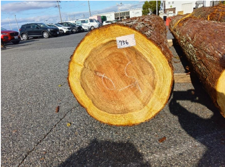
管理 NO.756 材長:4m 径級:50cm 材積:1.000 m 3