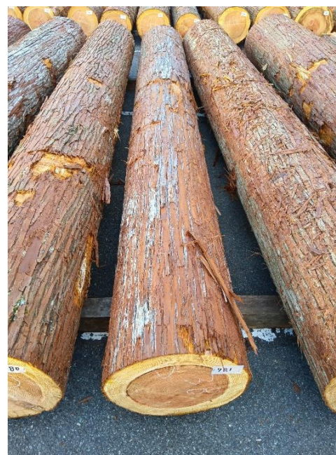
管理 NO.781 材長:4m 径級:38cm 材積:0.578 m 3