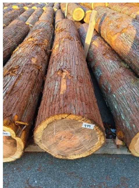
管理 NO.799 材長:4m 径級:52cm 材積:1.082 m 3