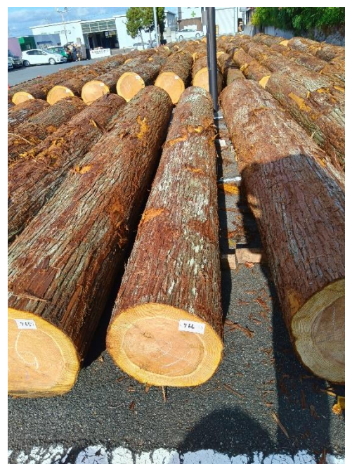
管理 NO.766 材長:4m 径級:40cm 材積:0.640 m 3