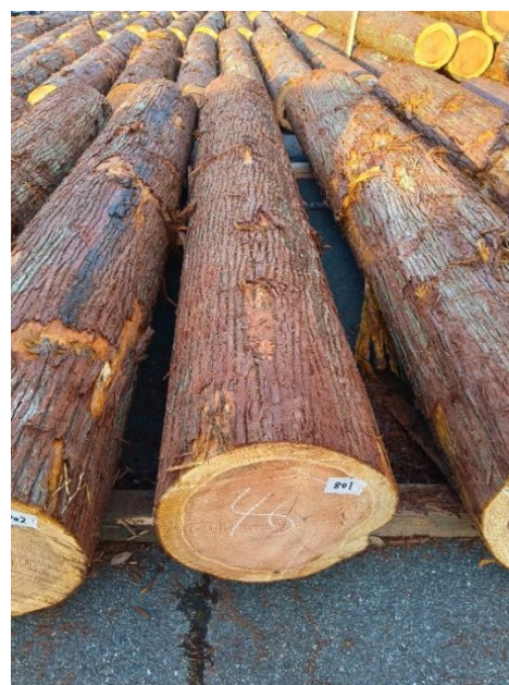
管理 NO.801 材長:4m 径級:46cm 材積:0.846 m 3