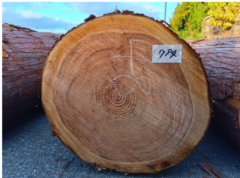
管理 NO.794 材長:4m 径級:48cm 材積:0.992 m 3