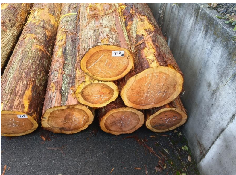
管理 NO.818 材長:4m 径級:34~50cm 6本 材積:4.050 m 3