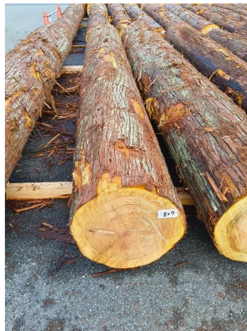
管理 NO.807 材長:4m 径級:46cm 材積:0.846 m 3