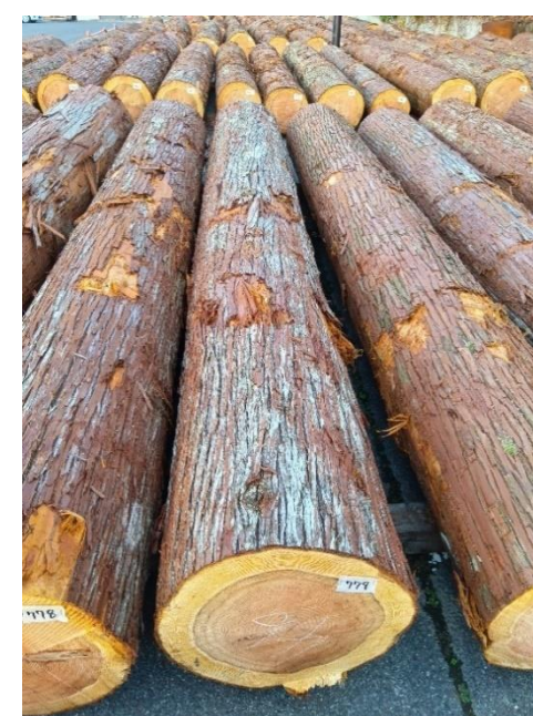
管理 NO.779 材長:4m 径級:46cm 材積:0.846 m 3