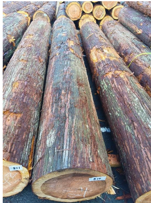
管理 NO.810 材長:4m 径級:46cm 材積:0.846 m 3