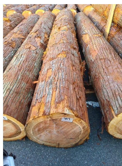
管理 NO.797 材長:4m 径級:48cm 材積:0.922 m 3