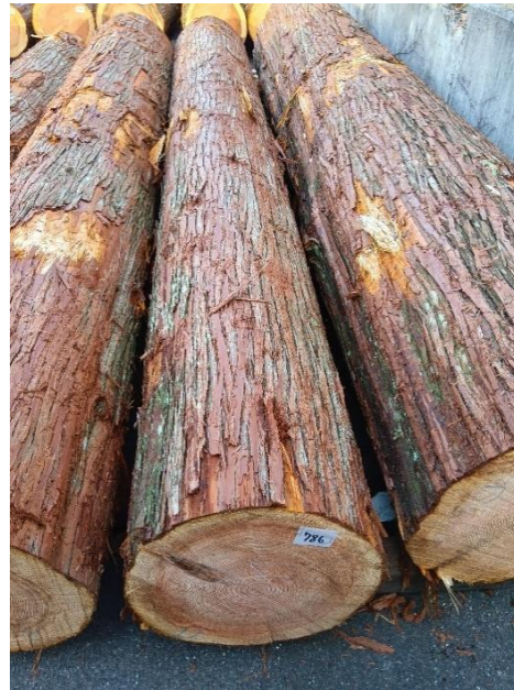
管理 NO.786 材長:4m 径級:46cm 材積:0.846 m 3