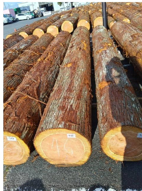
管理 NO.765 材長:4m 径級:46cm 材積:0.846 m 3