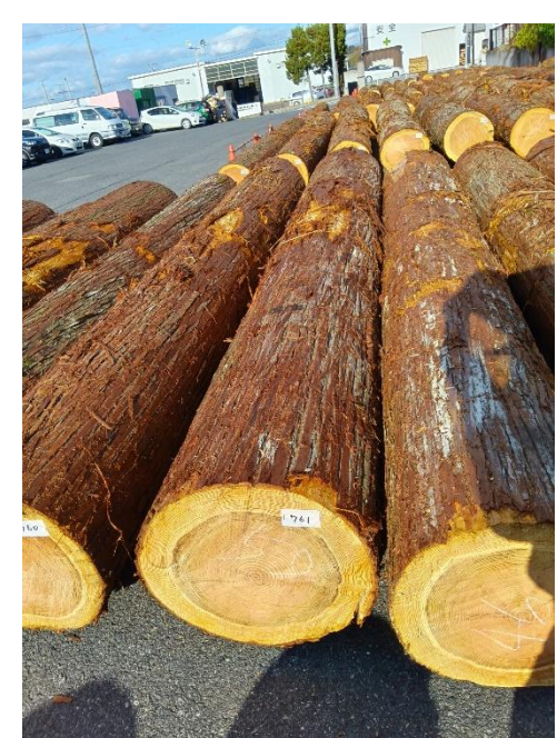
管理 NO.761 材長:4m 径級:50cm 材積:1.000 m 3