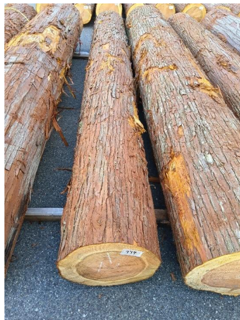
管理 NO.774 材長:4m 径級:42cm 材積:0.706 m 3