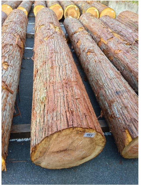
管理 NO.783 材長:4m 径級:50cm 材積:1.000 m 3