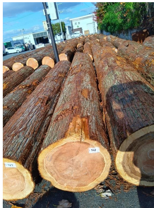
管理 NO.768 材長:4m 径級:52cm 材積:1.082 m 3