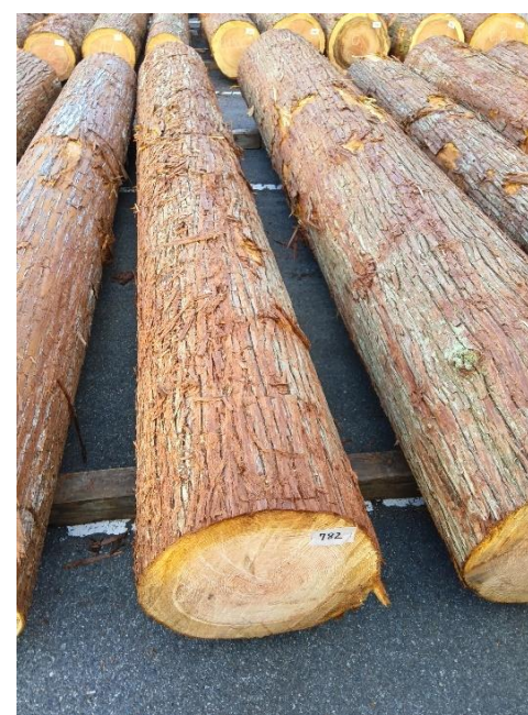
管理 NO.782 材長:4m 径級:44cm 材積:0.774 m 3