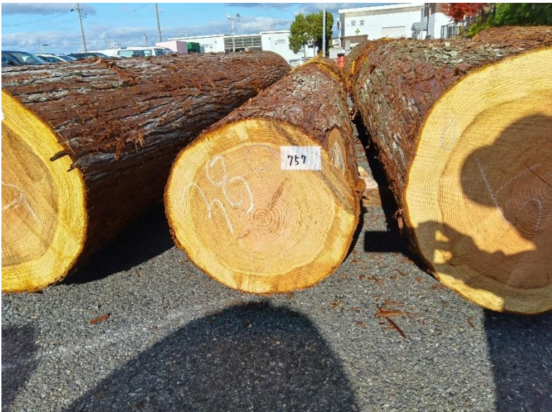
管理 NO.757 材長:4m 径級:38cm 材積:0.578 m 3