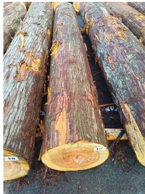
管理 NO.813 材長:4m 径級:40cm 材積:0.640 m 3