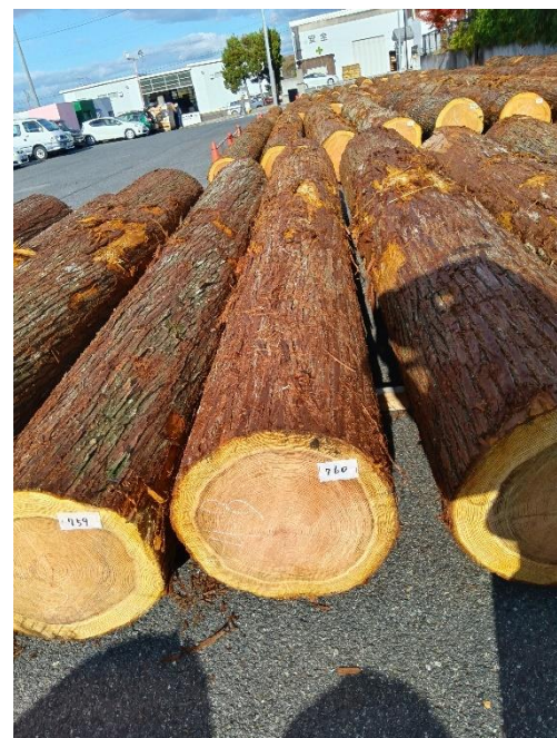
管理 NO.760 材長:4m 径級:48cm 材積:0.922 m 3