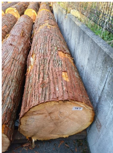
管理 NO.787 材長:4m 径級:60cm 材積:1.440 m 3