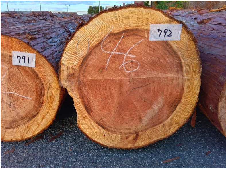
管理 NO.792 材長:4m 径級:46cm 材積:0.846 m 3