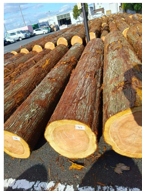
管理 NO.767 材長:4m 径級:46cm 材積:0.846 m 3