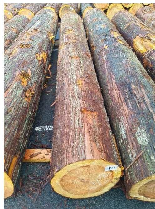
管理 NO.811 材長:4m 径級:42cm 材積:0.706 m 3