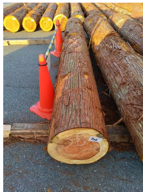
管理 NO.804 材長:4m 径級:38cm 材積:0.578 m 3