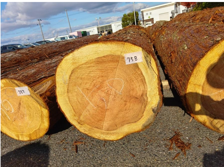
管理 NO.758 材長:4m 径級:50cm 材積:1.000 m 3